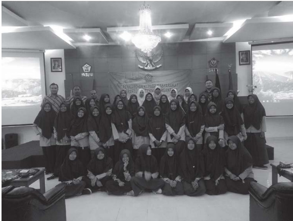
Gambar 2. Tim Pelaksana dan Peserta Pengabdian Kepada Masyarakat