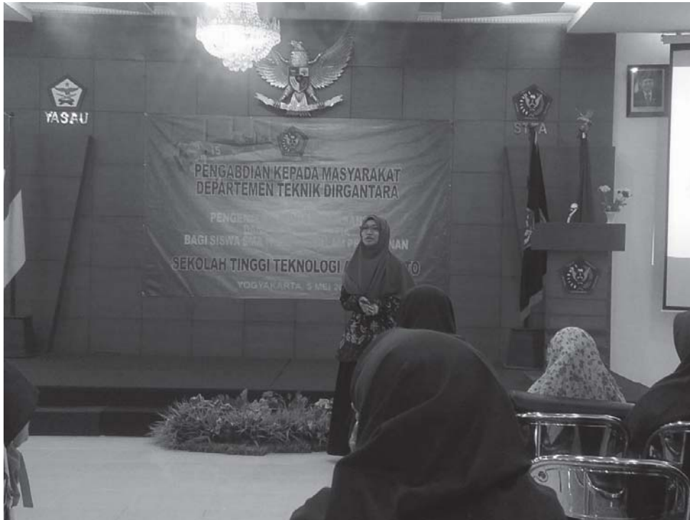
Gambar 3. Kegiatan Pelaksanaan Pengabdian Masyarakat di Ruang Adisutjipto Sekolah Tinggi Teknologi Adisutjipto

Setelah sesi pemberian materi berupa paparan atau presentasi di dalam kelas, dilanjutkan sesi yang kedua yaitu sesi kunjungan ke Laboratorium yang mana termasuk mengunjungi hangar tempat penyimpanan pesawat dan shop perawatan pesawat terbang, di mana di tempat tersebut merupakan tempat untuk pelaksanaan praktek secara langsung dari kegiatan pengajaran. Maka dengan kunjungan yang dilakukan oleh siswi SMA IT Baitussalam dapat semakin memperkuat pengetahuan yang diperoleh di dalam kelas pada sesi pertama, karena siswi dapat melihat secara langsung kondisi real di lapangan.