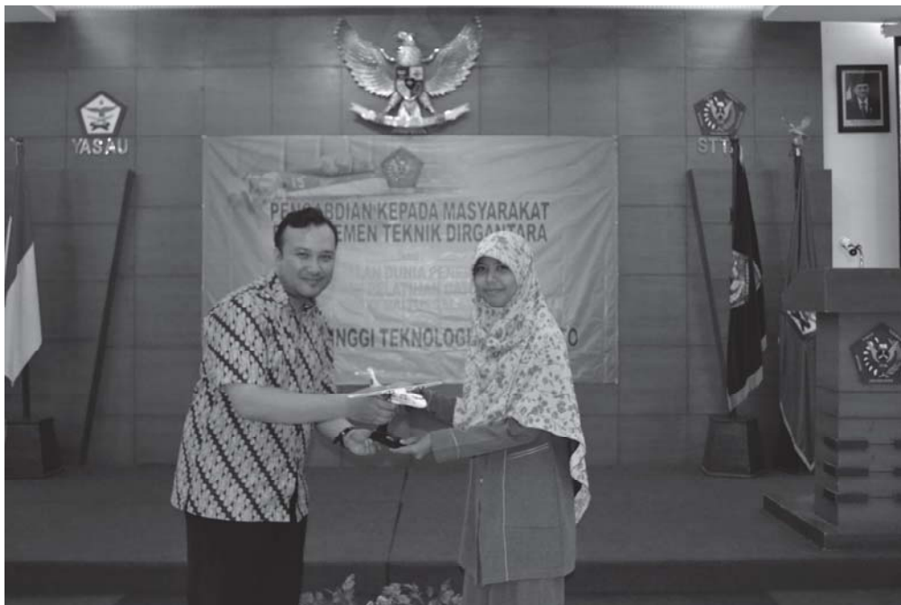
Gambar 5. Penutupan Kegiatan Pengabdian Kepada Masyarakat

Setelah pemberian materi di kelas dan kunjungan laboratorium selesai, penutupan acara dilakukan demo menerbangkan pesawat aeromodeling yang dibantu oleh UKM aeromodeling. Pada kegiatan ini siswi juga dapat ikut praktek langsung menerbangkan pesawat dari UKM aeromodeling. Pelaksanaan demo terbang yang dibantu oleh UKM aero modeling terdiri dari teknisi yang mempersiapkan pesawat untuk terbang dan juga pilot yang mengendalikan pesawat saat diterbangkan. Dengan demo yang dilaksanakan diharapkan semakin menambah pengetahuan siswa tentang dunia penerbangan pada