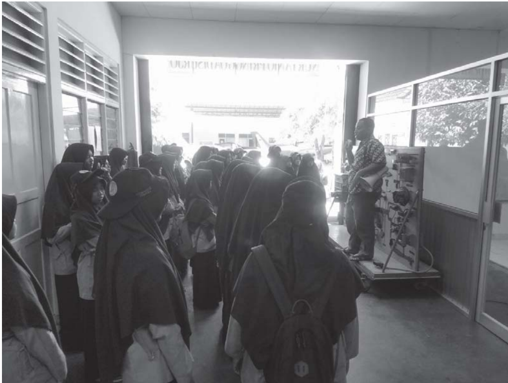
Gambar 4. Kegiatan Pengabdian Masyarakat saat Kunjungan ke Laboratorium